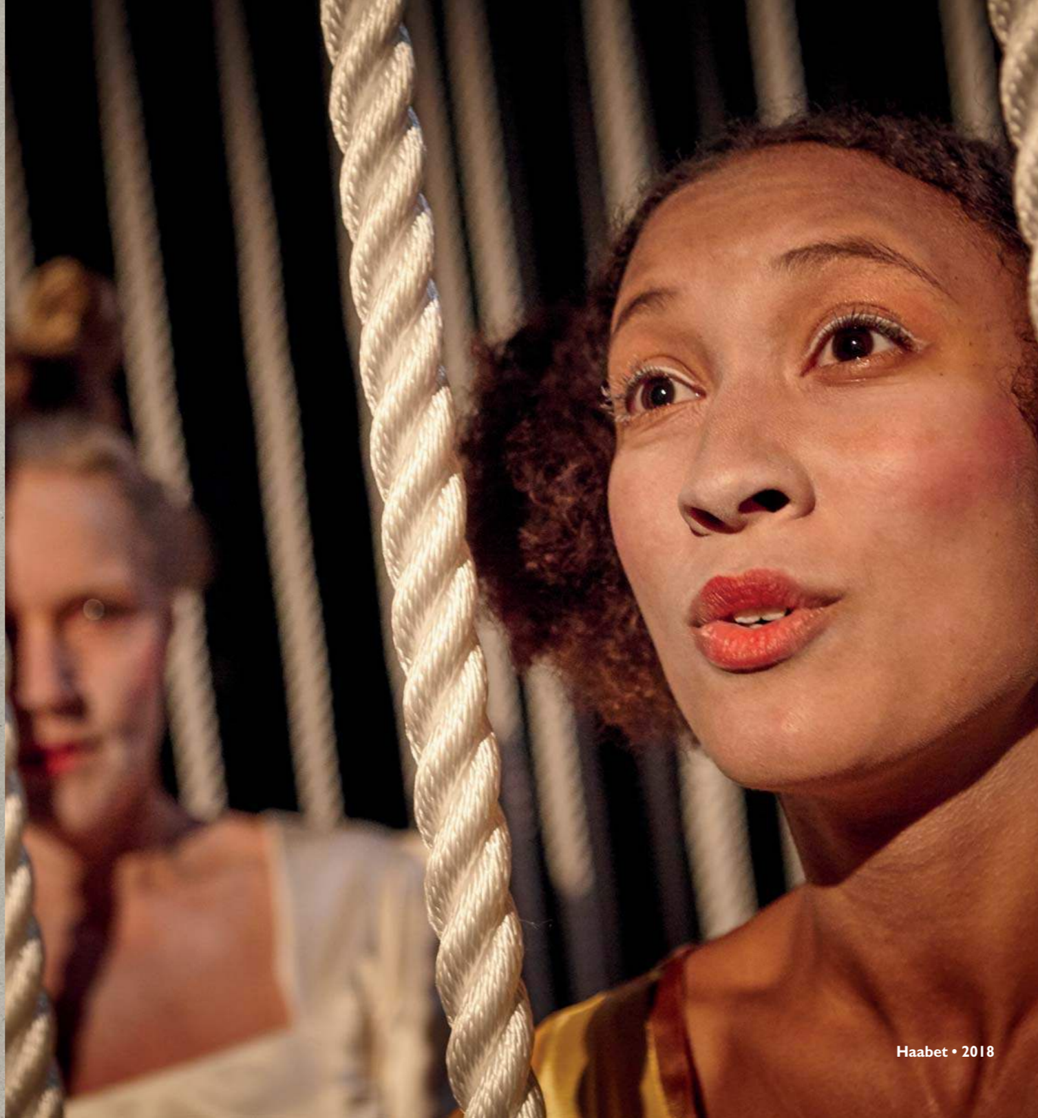
Haabet • 2018