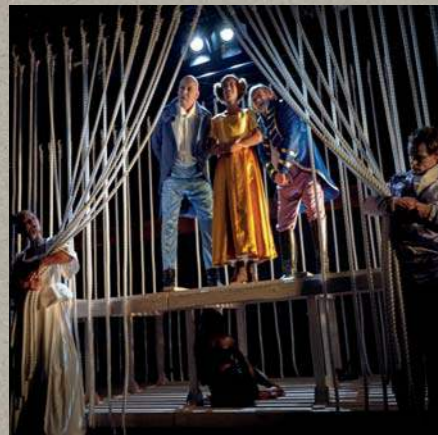
Haabet • 2018