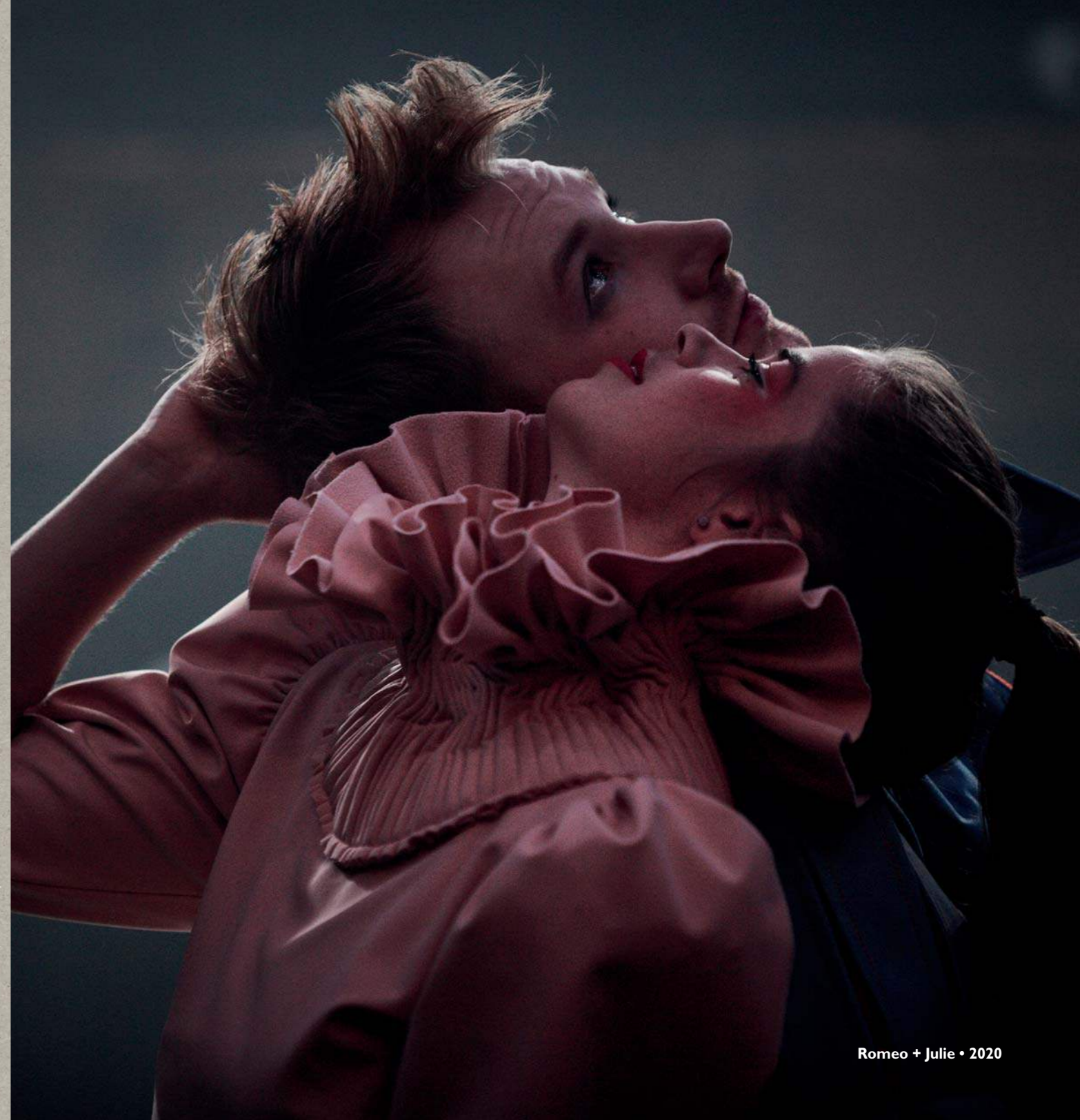
Romeo + Julie • 2020