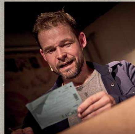
Alle gode ting • 2023