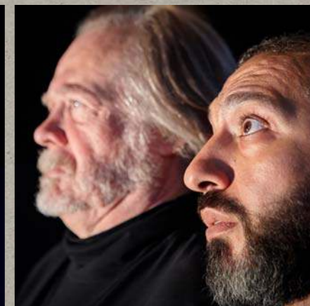
Sønderjyllands Stemme • 2016