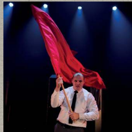
Arbejder - Sange fra hjertet • 2021