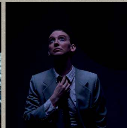
Den fremmede • 2026