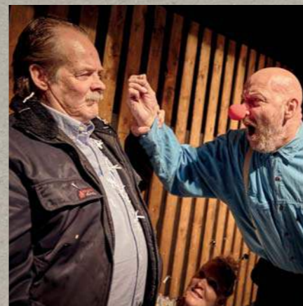
En mand der hedder Ove • 2015

På Teatret Møllen vil vi sikre, at endnu flere unge sønderjyske scenekunstnere tager skridtet ind på den professionelle scene. Vi vil understøtte dem og deres arbejde gennem vejledning, rådgivning og - når det er muligt - samproduktion for at tilbyde dem de nødvendige ressourcer og en platform, hvor de kan realisere og præsentere deres værker.