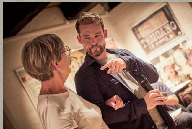
Alle gode ting • 2023

Vedvarende evaluering er afgørende for teatrets udvikling. Den giver os indsigt til at justere og forfinere vores strategi og arbejdsmetoder. Ved at definere og opbygge et sæt af relevante nøgletal kan vi følge vores fremskridt, sammenligne på tværs af branchen og kvalificere dialogen med vores interessenter.